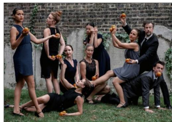
Les Gandini Juggling, spécialistes du jonglage.

Dans le cadre des festivités de "Villeurbanne, capitale de la culture française", les Nuits de Fourvière s'installent pour le week-end aux Gratte-Ciel. Au programme, samedi 2 et dimanche 3 juillet : ateliers de jonglage (inscription conseillée) et grand flashmob, spectacle des Gandini Juggling. Enfin, un spectacle étonnant illuminera la place, entre l'hôtel de ville et le TNP : "Borealis" de Dan Acher, des aurores boréales plus vraies que nature.